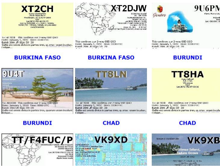
In de figuur hiernaast een voorbeeld van wat eQSL's

Als je niet geregistreerd bent kun je deze nog niet downloaden, daarna wel. Let op het verschil: er zijn calls vet gedrukt, die zijn zoals dat heet "authenticity guaranteed" en geldig voor de awards van eQSL, maar ook bijv. voor CQ-magazine en de DARC awards. De andere zijn in gewoon lettertype aangegeven en deze tellen nog niet mee voor awards. Hieruit kun je dus opmaken dat het erg belangrijk is om ervoor te zorgen dat jouw call ook goed en geldig wordt geregistreerd.