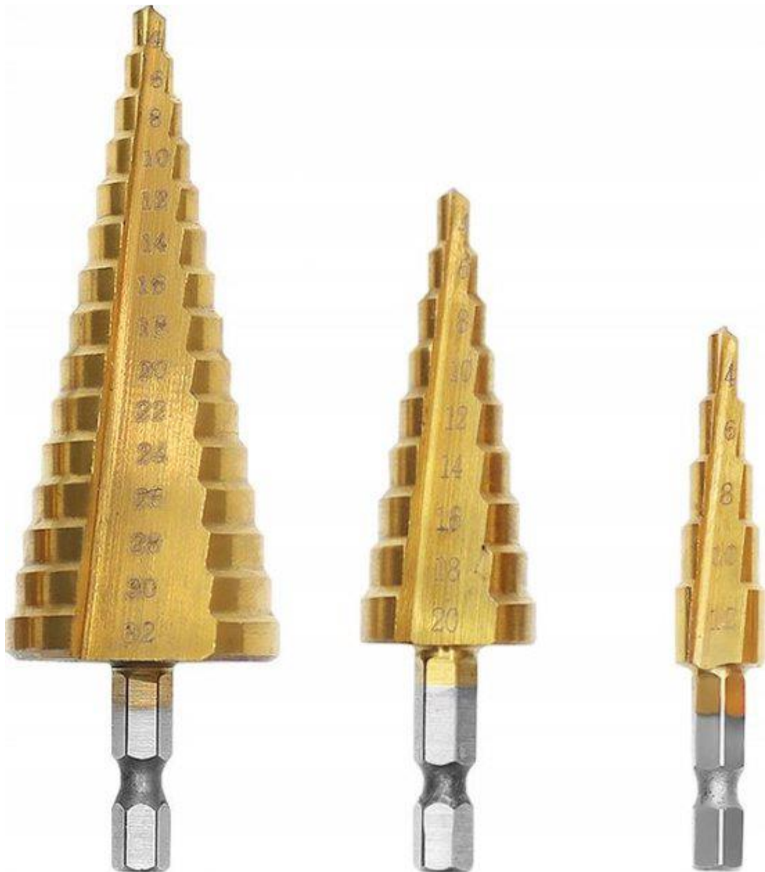
setje van 3 boren tot 32mm

Momenteel is bij de Lidl een setje TRAP BOREN te koop voor €9,- Bijzonder handig voor het maken van passende (ruime-) gaten in plaat- materiaal, kastjes e.d. want een standaard metaalborensetje schiet te kort bij bijvoorbeeld het maken van een gat voor een SO-239 chassisdeel (=het vrouwtje) waar je een PL-259 Amphenol plug inplugt. Een passend kastje maken om bijv. je zelfbouw antennetuner in te bouwen is dan zo gepiept! De boren zijn (als ze zijn uitverkocht bij het Lidl filiaal) ook in de Lidl webshop te koop. Menno, PE1LDZ