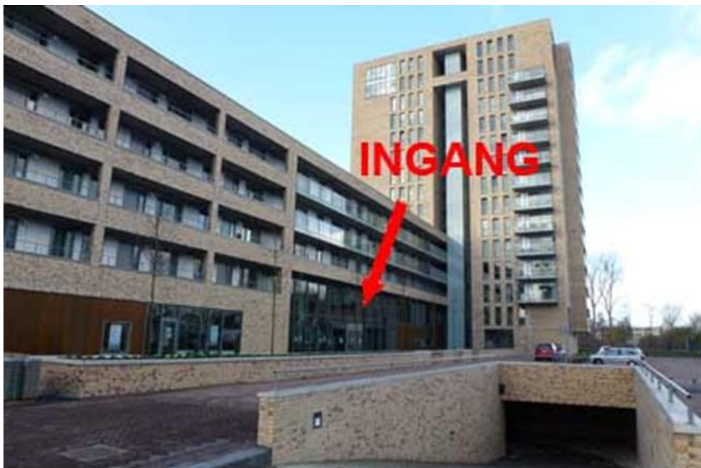
Gelegen tegenover treinstation Purmerend - Overwhere

12 jun 2025 (laatste avond voor zomerreces)